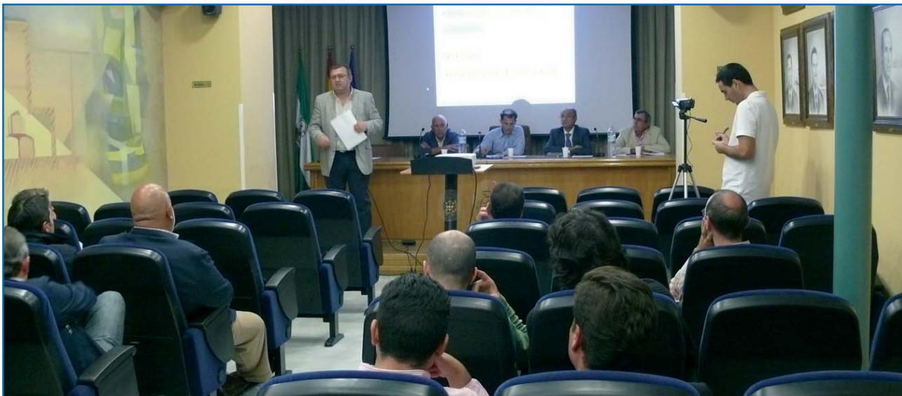
Al finalizar las primeras consideraciones de los ponentes se entabló un interesante debate con los socios

“En el sector instalación existe una gran precariedad, con niveles de subcontratación excesivos, una infraestructura de las empresas muy pequeña y atomizada, con poca o ninguna cualificación para realizar las pruebas de las instalaciones realizadas”.