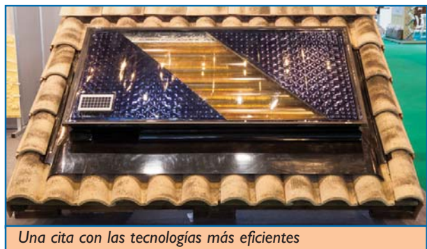
Una cita con las tecnologías más eficientes

Un Salón que, este año, se presentó especialmente marcado por la gran pluralidad de contenidos relacionados con las distintas fuentes energéticas -solar térmica, solar fotovoltaica y termosolar, hidráulica, biomasa, eólica y mini eólica, hidrógeno y pila, geotermia... – así como de aquellas propuestas enfocadas a mejorar el ahorro energético y que mostraron una interesante perspectiva de avances tecnológicos a la iluminación, la domótica, la cogeneración y la microcogeneración, el aislamiento, o la gestión energética, entre otros.