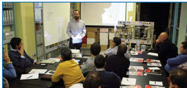
El seminario, éxito de asistentes

Para ello se realizó al inicio una introducción sobre teoría de válvulas y equilibrado hidráulico de sistemas HVAC. Conceptos sobre válvulas y equilibrado, destacando los tipos de equilibrado estático/dinámico, equipos necesarios, las aplicaciones típicas y la normativa aplicada, entre otros. En un segundo apartado se presentó una serie de válvulas de equilibrado y control independientes de la presión, incidiendo en el funcionamiento, dimensionado y selección, aplicaciones, optimización del bombeo y puesta en marcha de circuitos.