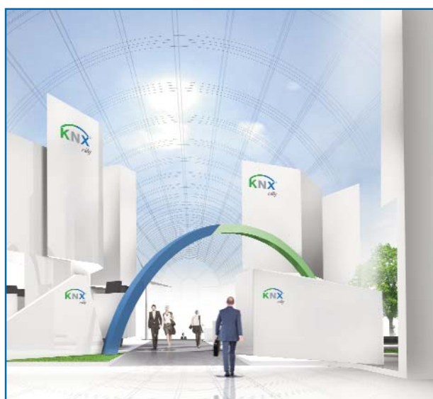
Una mirada al futuro desde el KNX

Por último se analizaron cada uno de los elementos del sistema KNX.