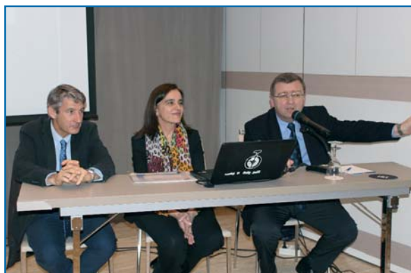
Imágenes de la presentación de Sevilla