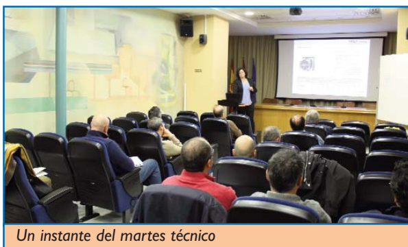
Un instante del martes técnico

En el se habló de la tendencia en las unidades de tratamiento de aire de garantizar unas mayores condiciones de confort y salubridad al mismo tiempo que se asegura un menor consumo energético. Los sistemas de filtración, control de calidad del aire y la recuperación efectiva de energía se pueden combinar en las UTAs como un tratamiento térmico e higroscópico del aire impulsado mediante ventiladores cada vez más eficientes. El objetivo, según se desgranó durante el evento, es que las nuevas generaciones de equipos debe resultar lo más flexible posible en funcionamiento, de forma que pueda adaptar todas sus variables (energía, caudal, presión, ventilación, etc.) a las necesidades puntuales de la instalación, evi-