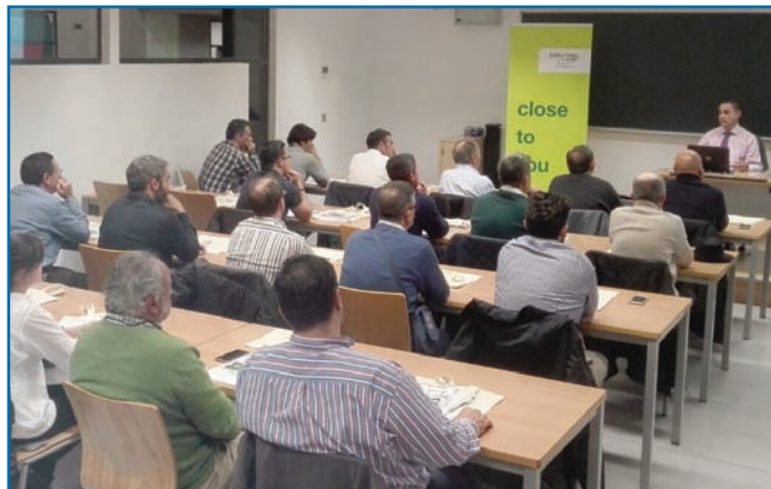
Los socios de Sevilla y Málaga acogieron a los representantes de Honeywell

Las normativas EN15232, EN13779 y DIN V 18599 establecen la incidencia del control en el ahorro energético en edificios. Estas normas hacen referencia a factores como la cantidad de aire, las pérdidas de presión, los puntos de consigna de temperatura, la calidad de aire de las estancias y el control flexible de todos los parámetros.