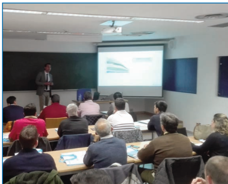
MT celebrado en Málaga

Por último se mostró en una clase técnica y comercial los avances más significativos de la firma en cuanto a climatización, calefacción, refrigeración, control y nuevos programas de diseño de edificios e instalaciones.