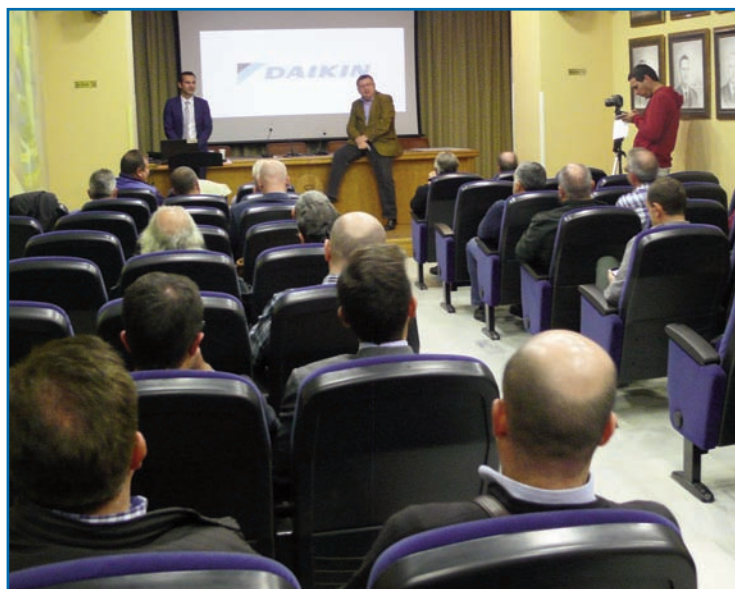
Mt celebrado en Sevilla